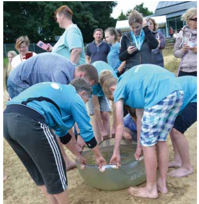
Der Badekappen-Füll-Wettbewerb war ein ganz besonderer Spaß beim Jubiläumsfest