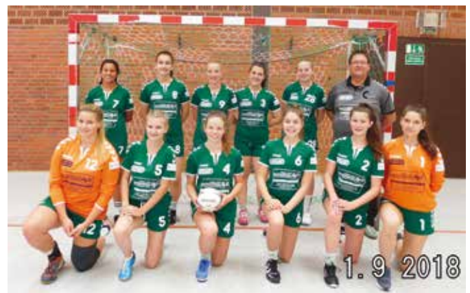
Die Bad Girls