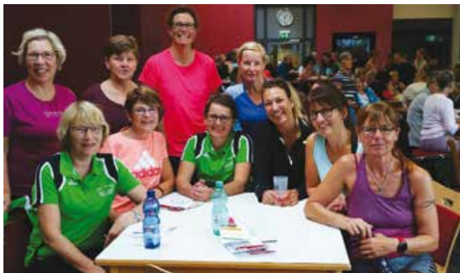
Frauensporttag in Bederkesa

Im Laufe des Jahres nahmen einige Teilnehmer meiner Sportgruppe und ich aber auch noch an anderen Aktivitäten teil.