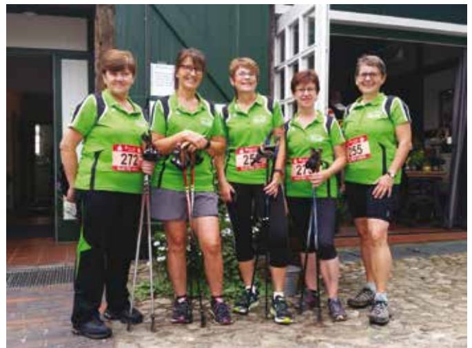
Die Teilnehmerinnen am Lauf in Bederkesa