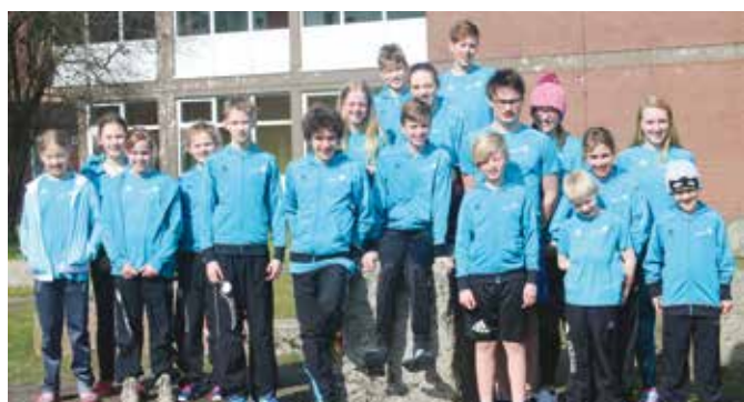
Foto: Die Schwimmer/innen der SSG An der Oste, die am Schwimmwettkampf „Ostermeeting“ in Wardenburg teilgenommen haben)

Ende März fand der Übernachtungswettkampf „Ostermeeting“ in Wardenburg statt. Dieser bei Schwimmer/innen und Kampfrichtern sehr beliebte Wettkampf war auch in 2018 wieder gut besucht. Die Kampfrichter lieben den Wettkampf wegen der guten Verpflegung. Die Schwimmer/innen nehmen hier jedes Jahr gerne teil, weil das „Wasser schnell ist“ und grundsätzlich super tolle neue persönliche Bestzeiten erzielt werden. So auch in 2018!