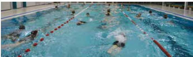
Foto: Die Beteiligung am Totenkopfschwimmen im Wingster Hallenbad ist in jedem Jahr groß.

Ende Oktober fand das bei allen Schwimmer/innen sehr beliebte Totenkopfschwimmen statt. Hier können alle Schwimmer, die Lust haben, zeigen, wie gut sie im Ausdauerschwimmen sind. Man kann das Totenkopfabzeichen im Dauerschwimmen von 1 Stunde, 1,5 Stunden oder 2 Stunden ablegen. Mit 30 Teilnehmern war das kleine Hallenbad in Wingst voll bis oben hin. Da es beim Totenkopfschwimmen aber nicht um Schnelligkeit geht, konnten alle Schwimmer/innen ganz in Ruhe ihre Runden drehen, bis sie ihr jeweiliges Soll erfüllt hatten. Alle 30 Teilnehmer konnten am Ende stolz ihren Aufnäher und die kleine Urkunde für das jeweilig erworbene Totenkopfabzeichen entgegennehmen.