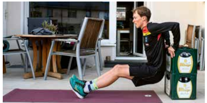
Trizeps-Übung „Dips“ mit zwei Bierkisten

Das gesamte Team der SSG An der Oste wünscht allen Sportlern, Triathleten und Schwimmern, dass sie die COVID-19-Pandemie gesund und fit überstehen.