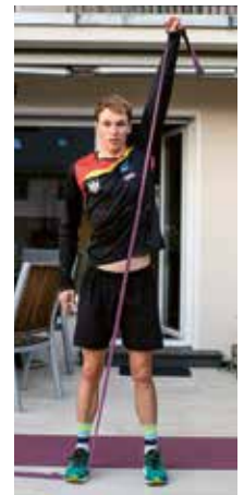
Diagonale Armstreckung mit dem Theraband